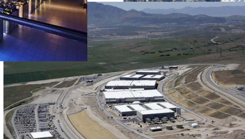
NSA Rechenzentrum, Utha