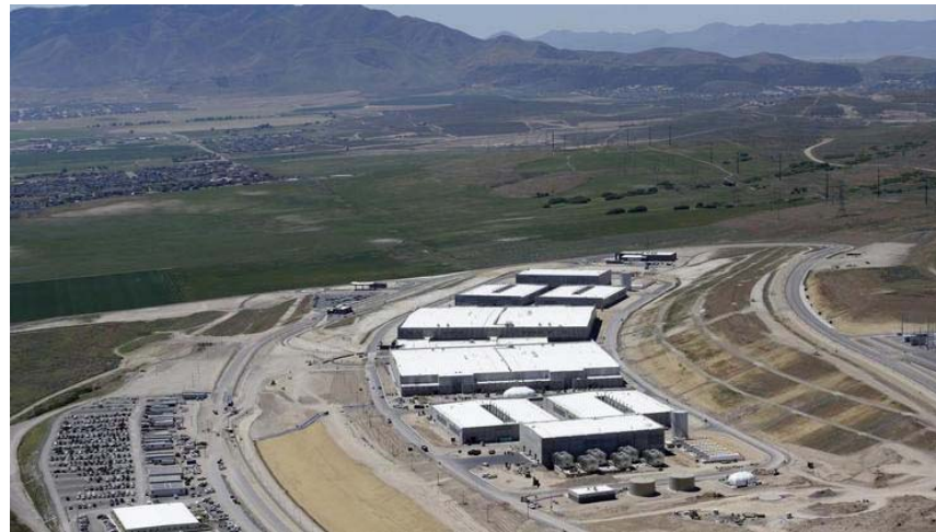
NSA Rechenzentrum, Uta