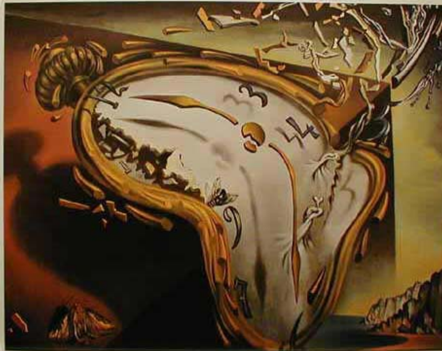
Salvador Dalí, Les Montres Molles, 1954, St. Petersburg/Florida