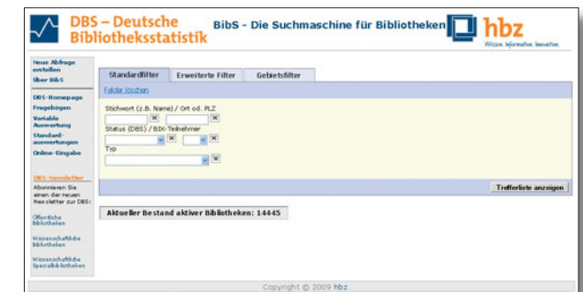
Die Suchmaske von BibS

Die Vergleichsbibliotheken können anhand zahlreicher Merkmale ausgewählt werden und im Browser, als CSV- oder Excel-Datei ausgegeben werden. Ausgewählte Bibliotheken können Sie direkt in BibS anzeigen lassen.